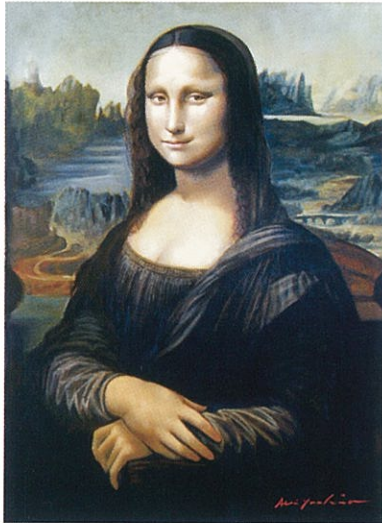
<モナ・リザの微笑み> 油彩 20号