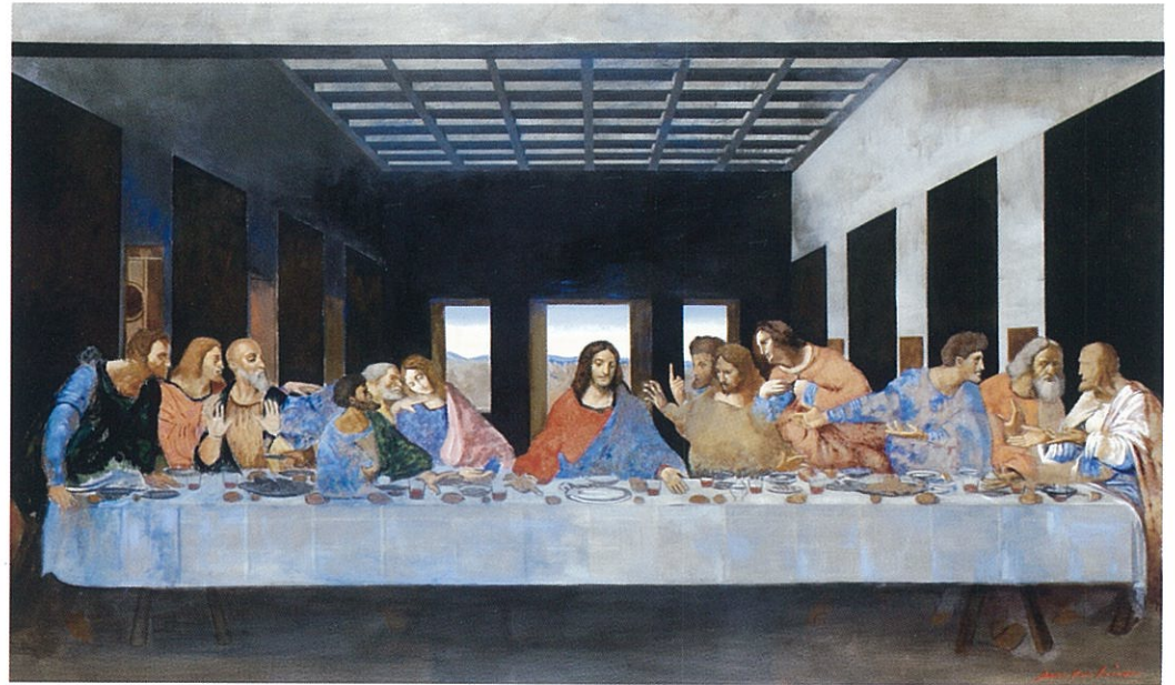
<最後の晚餐> 油彩 100号

本展では、ル・サロン展の出品作を中心に代表作 40 点と約 10 年の歳月をかけて、崇拜するレオナルド・ダ・ヴィンチの「モナ・リザ」「最後の晚餐」などの模写に挑戦し、本展に特別出展いたします。情感豊かな八代アートの世界をご堪能ください。