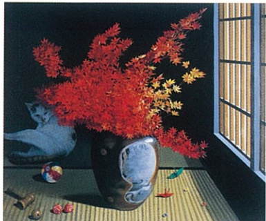
<愁陽> 油彩 50号 ル・サロン展 2010年出品作品