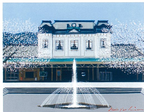
< 春の門司港駅 > 油彩 10号

主催 = ギャラリー ぐめさち 後援 = 北九州市・門司港レトロ倶楽部・北九州市観光協会・B & A 門司港・九州旅客鉄道株式会社・門司港開発株式会社・朝日新聞社・西日本新聞社・ 毎日新聞社・読売新聞西部本社・九州朝日放送・テレビ西日本・RKB 毎日放送・FBS 福岡放送・クロス FM 協賛 = 福岡ひびき信用金庫 お問合せ = 門司港レトロ総合インフォメーション(TEL. 093-321-4151)