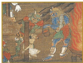
六道・十王図(部分) 室町時代