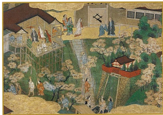
洛中洛外図屏風(部分 清水寺) 江戸時代