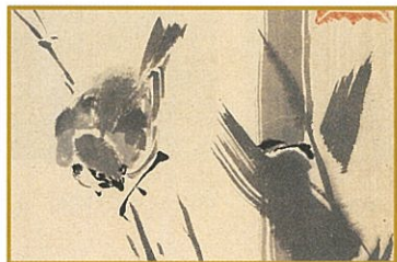
宮本武蔵筆 竹雀図(部分) 江戸時代