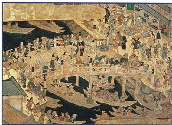
江戸名所図屏風(部分 日本橋) 江戸時代