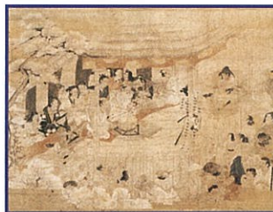
遊女歌舞伎図(部分) 江戸時代