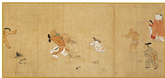
福富草紙(部分) 室町時代