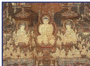
当麻曼荼羅図(部分) 鎌倉時代末~南北朝時代