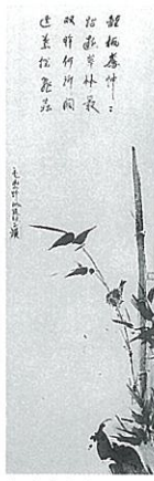
宮本武蔵筆 竹雀図 江戸時代