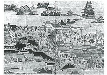
江戸名所図屏風 (部分 江戸城天守閣) 江戸時代

日本絵画の魅力はどこにあるのか？ それを知るためにはどのような鑑賞法があるのか？ という問いに答える展覧会です。出光コレクションの中から代表的な日本絵画を選び、仏画・絵巻・花鳥画・山水図・人物画・風俗画・浮世絵・文人画という内容に分けて展示構成し、それぞれの見方と魅力を説き明かします。ひとつひとつの作品をじっくりと時間をかけて鑑賞しながら、展覧会全体が醸し出す日本絵画特有の豊かな美の世界をご堪能ください。