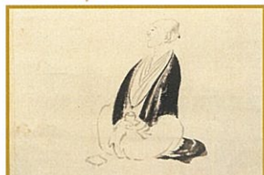
田能村竹田筆 自画像(部分) 江戸時代