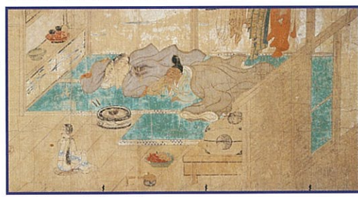
福富草紙(部分) 室町時代