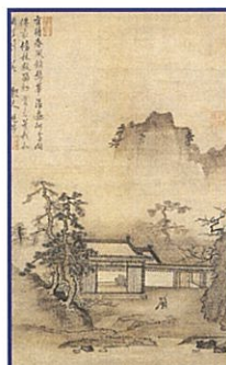
伝周文筆 待花軒図(部分) 室町時代