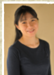
かるべいこ:自然食料理家 栄養士

1994年、ひよんなきっかけからコーヒー焙煎器煎機を購入。自宅でコーヒーの焙煎を始め、焙煎する絵描きとして「中川ワニ珈琲」の活動を開始。スローライフ愛好家の間で究極のコーヒーとして評判になり、雑誌でも多々紹介されるうち「もっとも手に入りにくいコーヒー」となる。全国各地で珈琲漫談、珈琲教室を行っている。