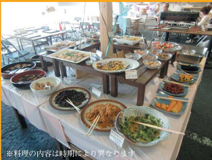
※料理の内容は時期により異なります