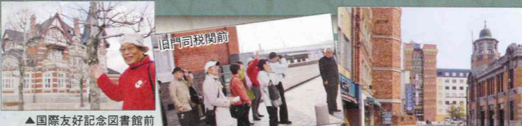
▲国際友好記念図書館前