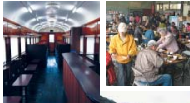
左上: 駅の横の休憩所「かんもん号」 右上: めかり潮風市場 右下: めかり潮風広場のタコのすべり台は国内最大級!

関門海峡めかり駅横に「めかり潮風市場」ができました。地産地消バイキングコーナーや、地元市場の出張販売コーナー観光情報コーナーなどがあります。また、同駅前の「めかり潮風広場」には、お子様が遊べる大型遊具も登場。引退客車を利用した休憩所では、カウンターで飲み物や軽食を販売します。