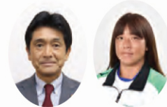
東京オリンピック 日本選手団 団長 福井 烈氏

マリングートもじから関門海峡ミュージアムイベント広場までの約600mの記念ランを行います。ゲストランナーとして、門司出身で東京オリンピック日本選手団団長を務めたプロテニスプレイヤーの福井 烈氏、東京パラリンピックでパラアーチェリー日本代表の重定 知佳選手も参加します！