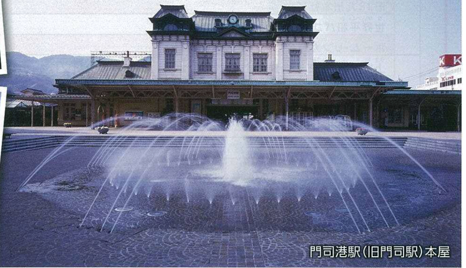
門司港駅(旧門司駅)本屋