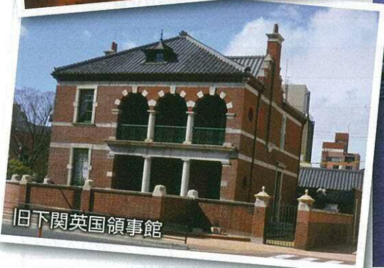
旧下関英国領事館