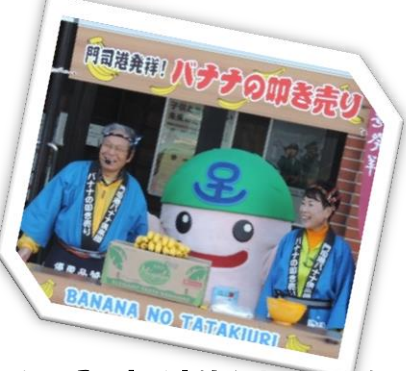
バナナの叩き売り実演もあります!

大里商店連合会【大里バーガー】、ひぐらし軒【パン】、小倉焼うどん研究所【焼うどん】、門司港ちゃんら〜倶楽部【門司港ちゃんら〜】、ぺったん若松焼き隊【ぺったん焼き】 cafeBONGO【生パスタ】ほか手焼きちくわ、からあげ、ラーメンなど多数