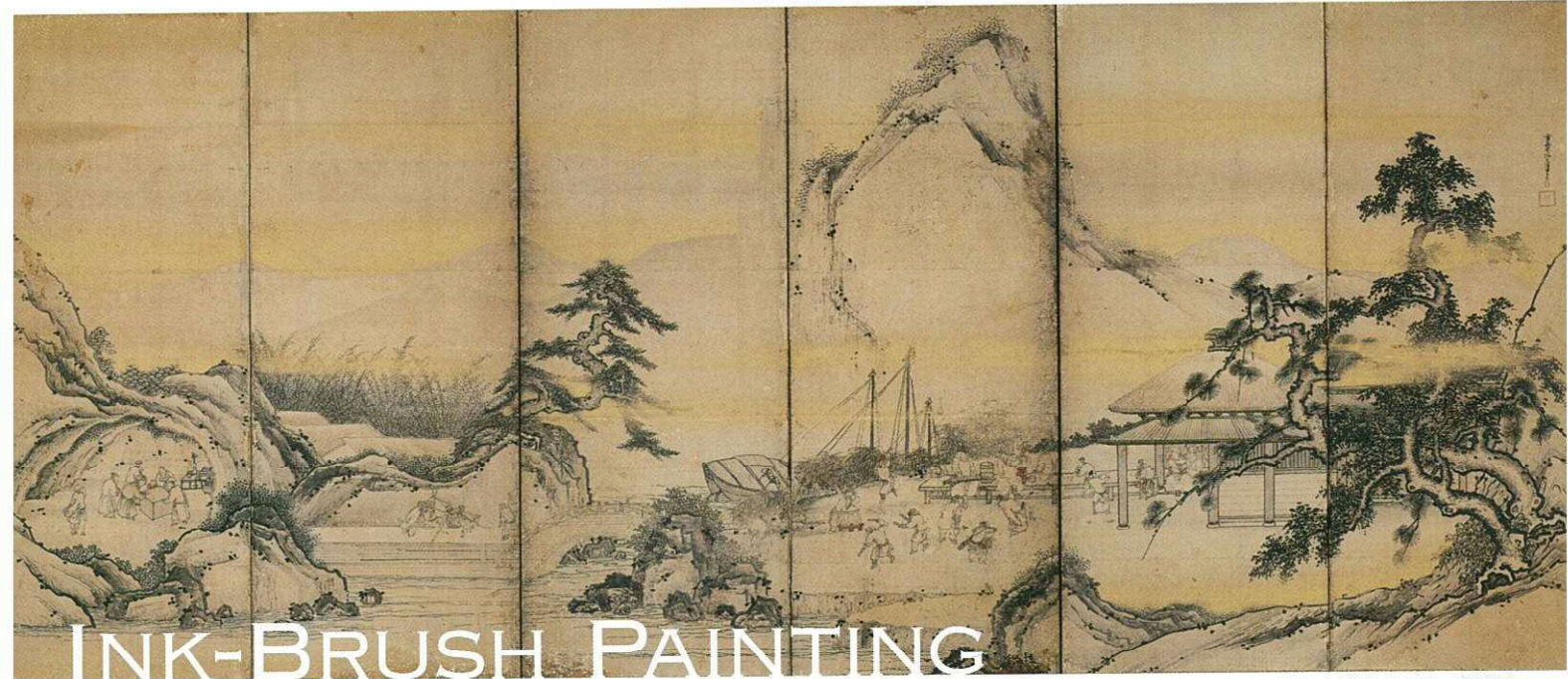
琴棋書画図屏風(右隻) 雲澤等悦 江戸時代 重要美術品