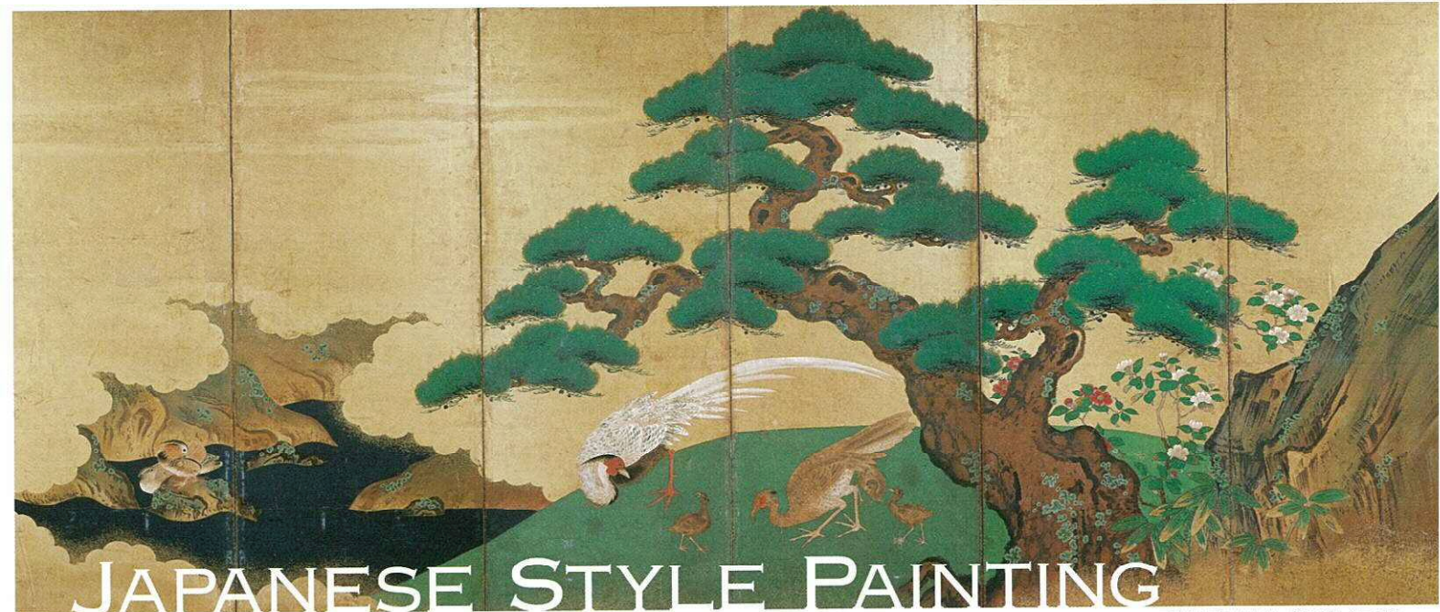
四季花鳥図屏風(右隻) 狩野守徳 江戸時代

開館時間—午前10時～午後5時(入館は午後4時30分まで) 休館日—毎週月曜日(ただし9月21日、10月12日は開館) 入館料—一般600円/高・大生400円(団体20名以上、各100円引)、 中学生以下無料(ただし保護者の同伴が必要です) ※障害者手帳をお持ちの方は100円引、その介護者1名は無料です 講演会—2015年10月19日(月)(午後2時～3時30分) 場所:旧大連航路上屋2階ホール 演題「色彩の美・墨の美-日本絵画のふたつの流れ」 講師:田中伝(出光佐三記念美術館学芸員) (予約:定員150名、聴講料700円) ※当日は予約者のみ入館可 列品解説—第2、第4日曜日(午後2時～、午後3時～) 住所—〒801-0852 福岡県北九州市門司区港町7-18 旧大阪商船2階 JR門司港駅より徒歩1分(門司港レトロ地区内、門司港ホテル前) ※専用の駐車場がありませんので、周辺の市営駐車場をご利用ください TEL=093-332-0251 主催—出光美術館、出光佐三記念美術館、出光興産、読売新聞社