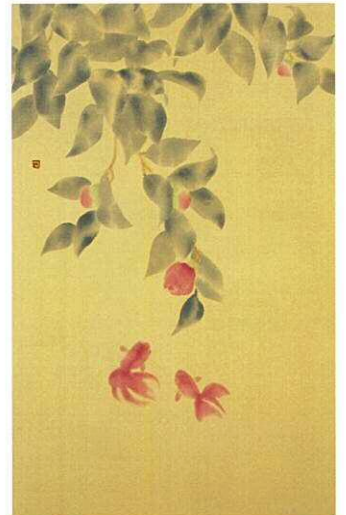
椿に金魚 65.0 × 41.0cm