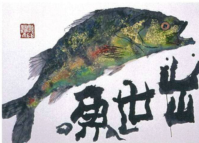
出世魚 53.0 × 72.7cm