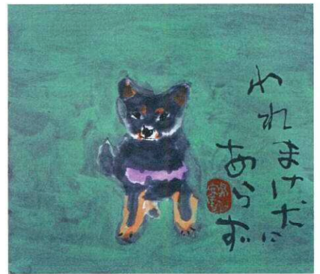
われまけ犬にあらず 24.0 × 27.0cm

高校卒業後、片岡鶴八に弟子入り。3年後、東宝名人会、浅草演芸場に出演。その後、バラエティー番組を足掛かりに広く大衆の人気者になる。目下、幅広いキャラクターを演じられる役者として活躍し、日本アカデミー賞最優秀助演男優賞など数多くの賞を受賞している。画家としては、1995年に初の絵画展「とんぼのように」を東京で開催。以降、毎年新しい作品での個展を開催している。2001年、初の海外個展をフランス・パリにて開催し、好評を博す。2003年～2005年には、NHK趣味悠々「鶴太郎流墨彩画塾」にて墨彩画の極意を伝授。2011年、初の本格的仏画を出版。2013年に第69代横綱白鵬関の化粧まわしのデザインを担当し、伊勢神宮で奉納・お披露目された。画業を積み重ね、その心に奏でられた色彩は多くの人々を魅了している。