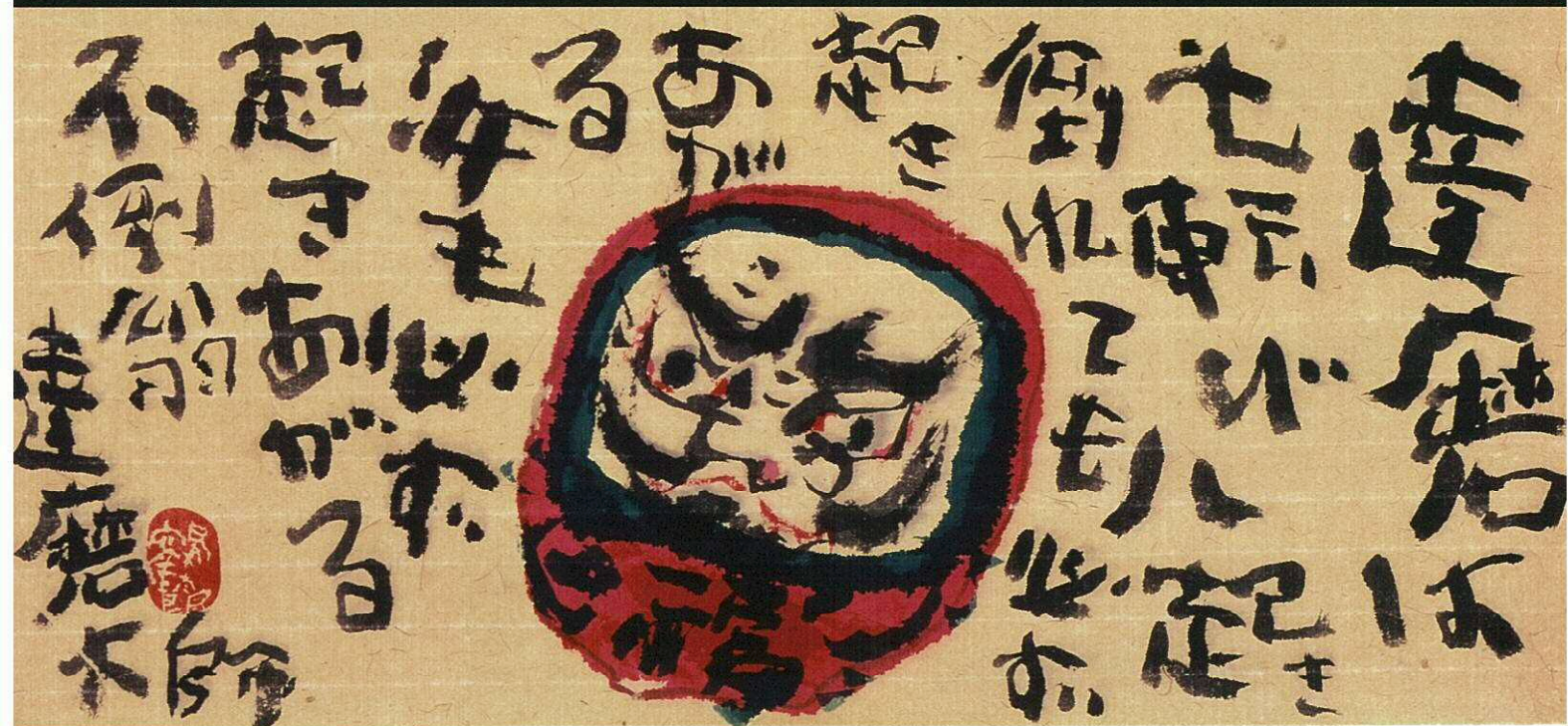
達磨 20.5 × 45.5cm