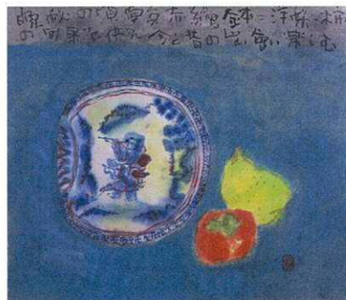
南京赤繪染付 51.0 × 58.0cm