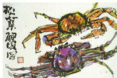
松葉蟹図 70.0 × 105.0cm