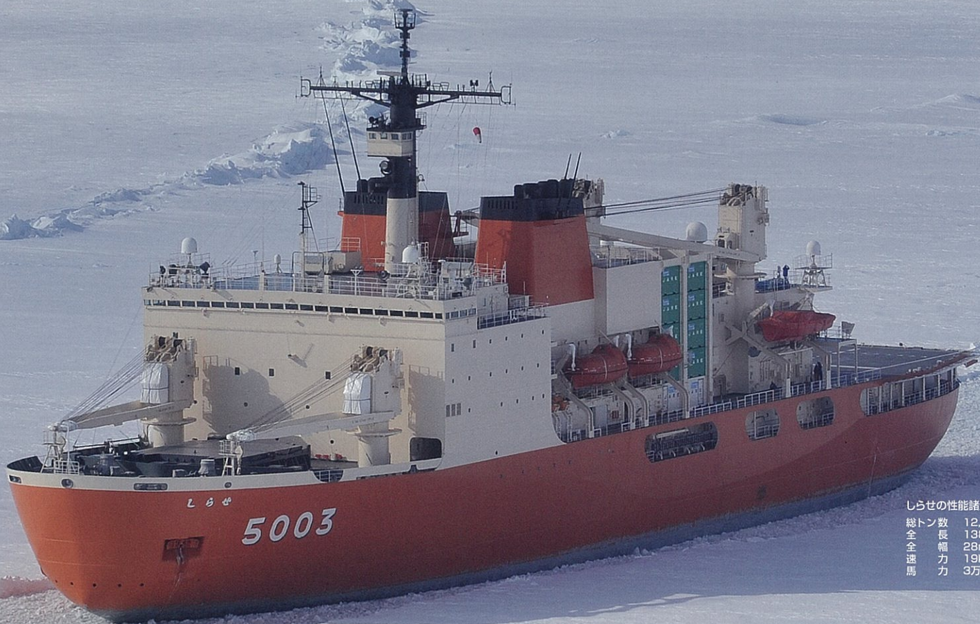
しらせの性能諸元