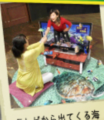
テレビから出てくる海