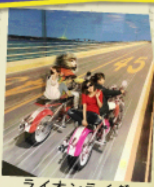
ライオンライダー